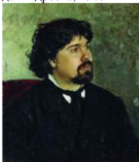
Портрет художника Василия Сурикова, 1877