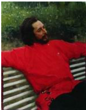
Портрет писателя Леонида Андреева, 1905