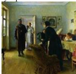
Не ждали, 1884