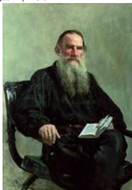
Портрет писателя Л.Н.Толстого. 1887

МБУК «МЦБ Каневского района» Отдел библиотечных инноваций и информационных технологий