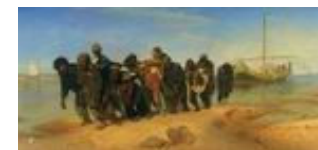
Бурлаки на Волге, 1873