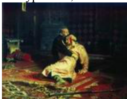
Иван Грозный и сын его Иван 16 ноября 1581 года, 1888