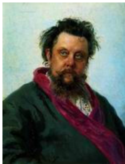
Портрет композитора М.П.Мусоргского. 1881