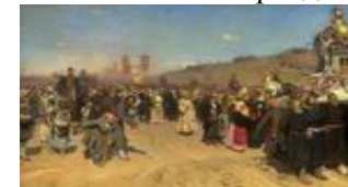
Крестный ход в Курской губернии. 1880-1883

стремящийся вникнуть в существо тех отношений и процессов, которыми определялась русская действительность пореформенной эпохи, Репин, работая с невероятной энергией, создает одно за другим произведения, в которых эта действительность отразилась в огромном многообразии. Так вот и писал Репин все свои грандиозные полотна :