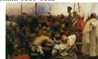
Запорожцы пишут письмо турецкому султану. 1880-1891